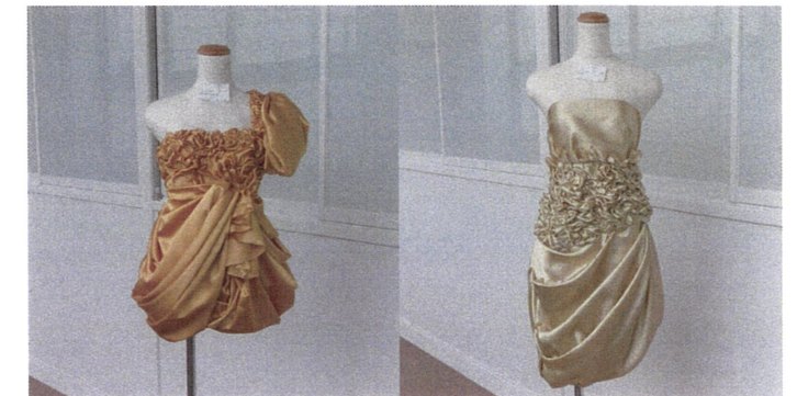
ピンワーク作品：6mの布地とピンだけで仕上げていきます。