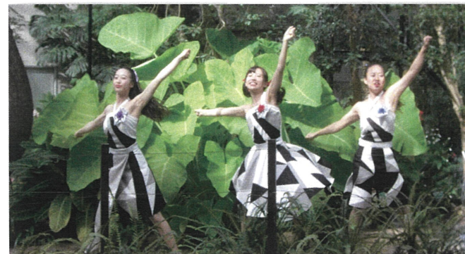
2年 科目「ファッション造形」でのワンピース（宇部市依頼作品）