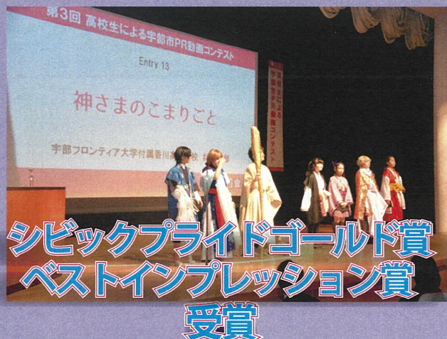
シビックプライドゴールド賞 ベストインプレッション賞 受賞