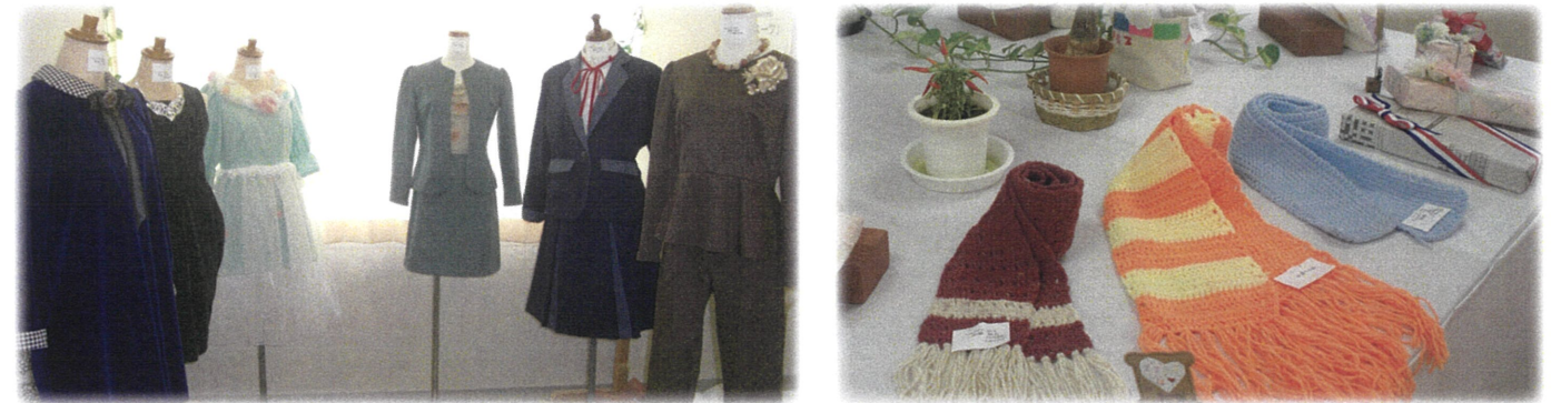
3年 科目「ファッション造形」でのスーツ製作